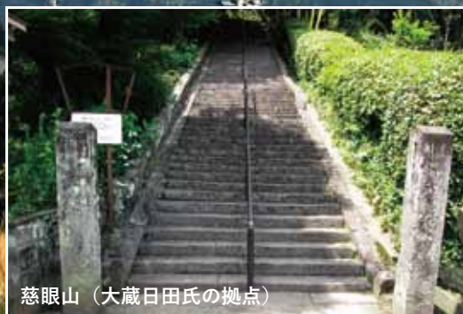
慈眼山 (大蔵日田氏の拠点)