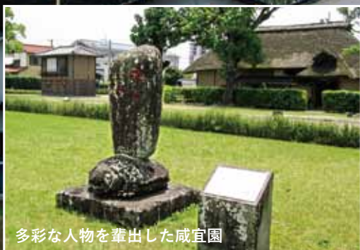
多彩な人物を輩出した咸宜園